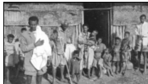
Storfamilien er en vanlig familief orm i Etiopia.

Alle arbeidsoppgaver: se www.nupi.no/pub/hhd/arb.html