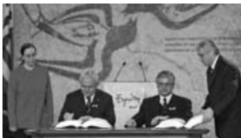
Den polske statsminister Miller og utenriksminister Cimoszewicz signerer Polens avtale med EU.