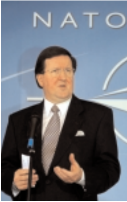
NATOs generalsekretær Lord Robertson

Hva ligger i NATO-paktes artikkel 4 og 5? Gå gjerne til kildene. Norsk oversettelse på www.dnak.org . Art. 4: «Partene vil rådslå med hverandre når som helst en av dem mener at noen parts territoriale ukrenkelighet, politiske uavhengighet eller sikkerhet er truet.»